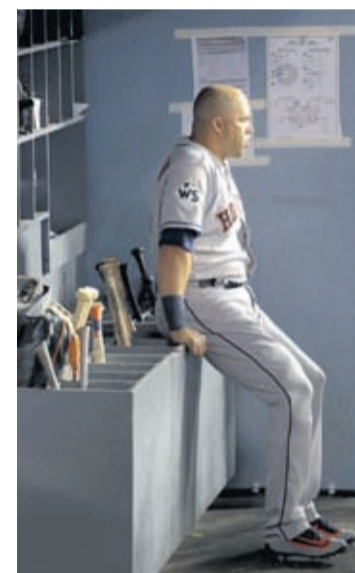
manager na 2018, tempo cu nan a gana Serie Mundial.

Beltran a hunga e ultimo di su 20 temporada den big league cu Astros na 2017. Manfred a bisa cu e aña ey, ex-manager di Boston Red Sox, Alex Cora tabata un 'participante activo' y a desaroya e sistema di horta seña uza pa e team, aludiendo fuertemente cu e lo enfrenta castigo severo. Maske a despiedi Cora subsecuentemente, Red Sox ta permanece bou investigacion pa horta seña durante prome temporada di Cora como